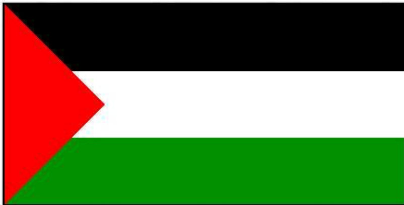
Palestinas flagga Flaggans utseende bestämdes år 1964.